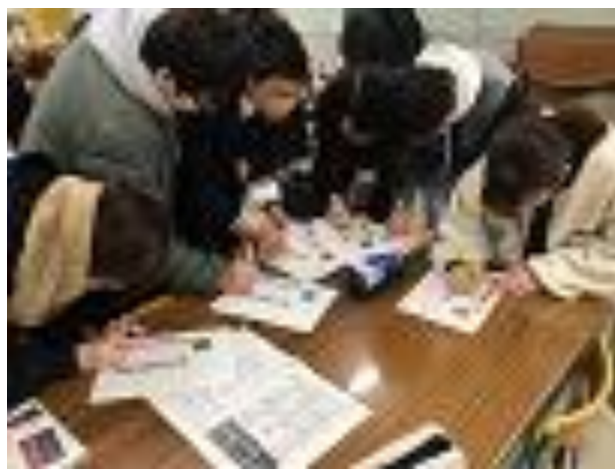
事前練習・ワークショップ

国際協力を軸とした音楽活動を展開するJICA東京SDGs吹奏楽団と音楽を愛する中学生、高校生、若者たちが、SDGsの目標14「海の豊かさを守ろう：海洋と海洋資源を持続可能な開発に向けて保全し、持続可能な形で利用する」をテーマに、海にちなんだ曲を演奏を行なう合同ステージを開催しました。