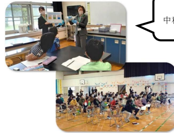
中和している写真。

小学生に幼い頃から環境に興味を持ち考えてもらいたいという思いから始まったプロジェクト。