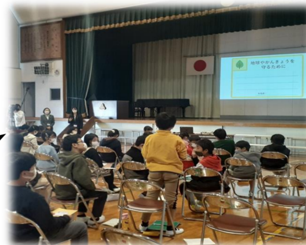
楽しんで参加している小学生♪

2021年「ごみと水のゆくえ」 静岡市大川小中学校（4年生 4人） 2022年「ごみの行方」 静岡市森下小学校（5年生 53人） 2023年2月・・・実施予定!!