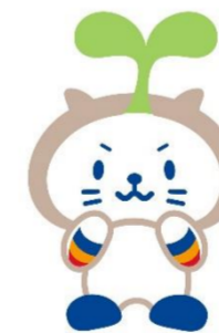
しずおか焼津信用金庫 キャラクター「たねココ」