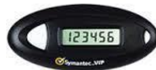
画像④ VASC Oモデル トークンID頭4桁 DP03、DP06