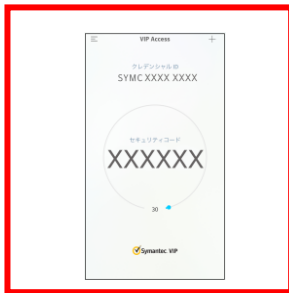
画像⑤ スマートフォン用 クレデンシャルID頭4桁 VSMT、VSTZ SYMC、SYMZ