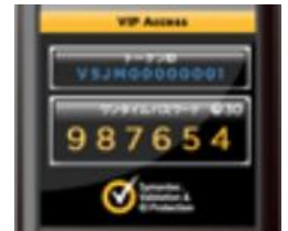
画像⑦ フィーチャーフォン (携帯電話) 用 <トークンID頭4桁> VSJM