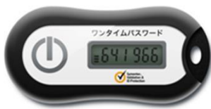
画像③ 飛天モデル トークンID頭4桁 FT20