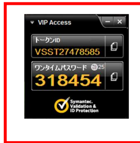
画像⑥ パソコン用 トークンID頭4桁 SYDC、VSHM VSST