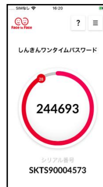
画面イメージ シリアル番号の頭4桁 SKTS